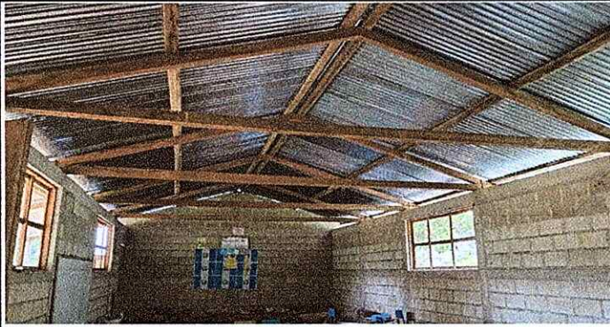
Foto1: Instalacion de Costaneras